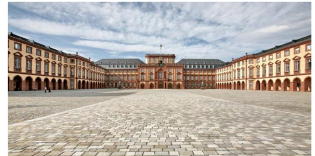
Bachelor of Arts