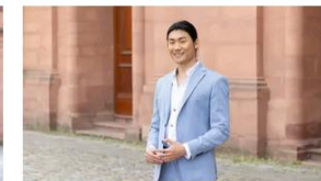
Yijiao aus Peking, China