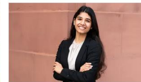
Tushna aus Indien