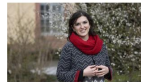
Marina aus Nizza, Frankreich