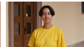
Fine aus Schwerin, Deutschland