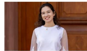
Denitsa aus Pleven, Bulgarien