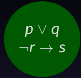
Systematik der Philosophie (3 Veranstaltungen; 16 ECTS)