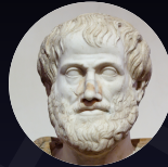
Geschichte der Philosophie (3 Veranstaltungen; 16 ECTS)