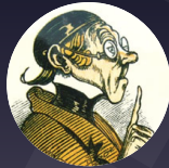
Ethik (3 Veranstaltungen; 16 ECTS)